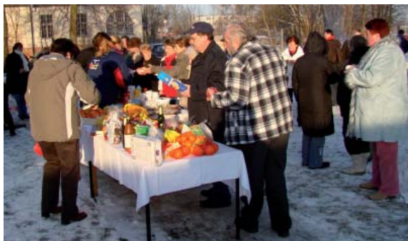
Der alternative Neujahrsempfang 2009 war ein großer Erfolg

Vorsitzende des Ortsverbandes Hoppegarten