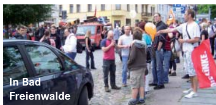
In Bad Freienwalde