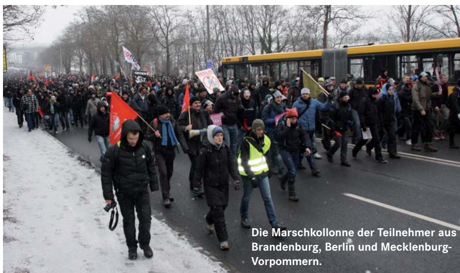
Die Marschkolonne der Teilnehmer aus Brandenburg, Berlin und Mecklenburg-Vorpommern.