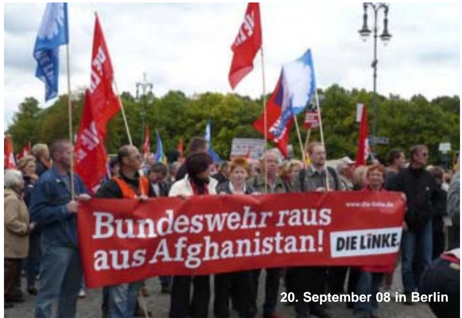
20. September 08 in Berlin

Große Straße 76, 15344 Strausberg Telefon: (03341) 31 17 96 Telefax: (03341) 31 47 75 Öffnungszeiten: Mo. bis Do. 9 - 12 Uhr